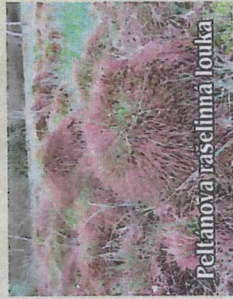
Peltánova rašelinná louka