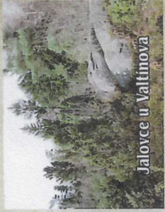
Jalovce u Valtínova