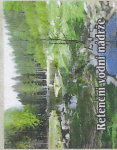
Retenční vodní nádrže